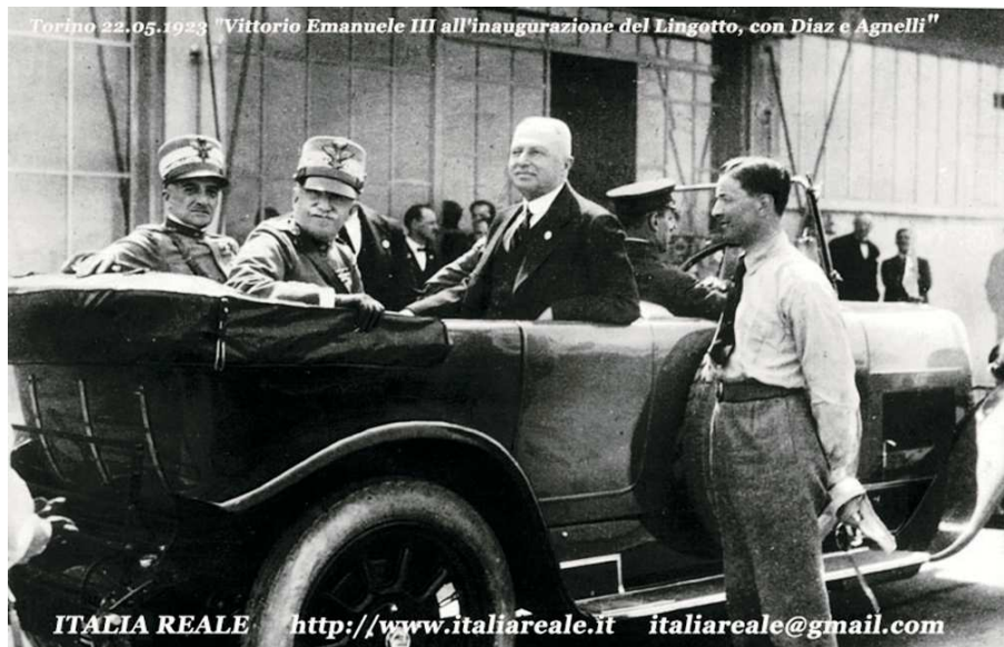
Torino 22.05.1923 "Vittorio Emanuele III all'inaugurazione del Lingotto, con Diaz e Agnelli"

Il giorno dell'inaugurazione, il Re Vittorio Emanuele III provò la pista sopra il Lingotto a bordo di un'auto guidata dal pilota Felice Nazzaro.